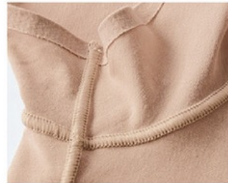
当商品の縫製(肌側)