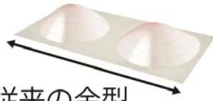
従来の金型 カップ以外は平面

バストだけでなくサイドまで体の丸みにフィットする3Dの立体設計で、柔らかい大人のお肉も無理なくやさしく整えてくれます。