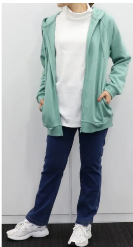
フェードブルーコーディネート例 (スタッフ身長161cm、M-68cm着用) ※パーカーは品番NB-6891、カットソーは品番NB-6651