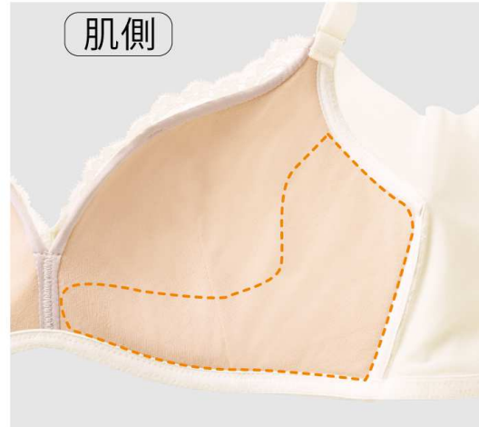
内蔵内寄せパネル